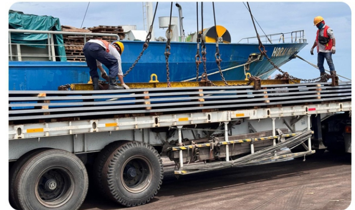
DOOR TO DOOR