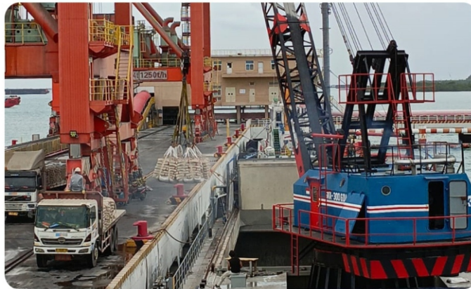
PORT TO DOOR