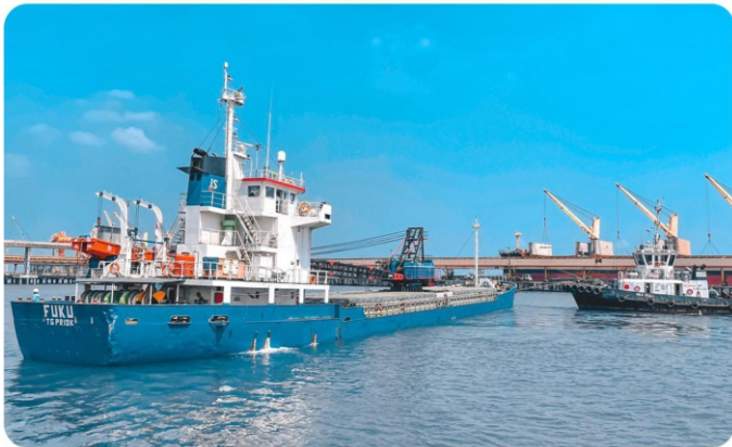
PORT TO PORT